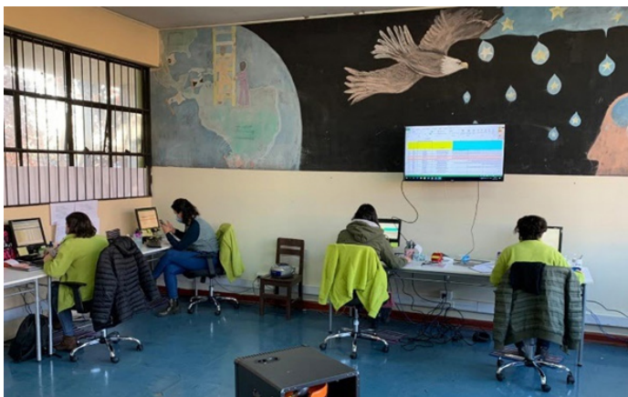
Figura 2: Centro de trazabilidad de la comuna de El Bosque.

augmentar de manera progresiva la búsqueda activa de casos, alcanzando en la actualidad al 54% de los test realizados, manteniendo además una cobertura promedio de testeo del 92% del total de casos, y alcanzando en promedio un 96% en la oportunidad de notificación de resultados. A pesar de lo anterior, aún existen desafíos en la oportunidad de la investigación epidemiológica para casos confirmados de infección por SARS-CoV-2 y para sus contactos estrechos, como también en la identificación de estos contactos. Desde el punto de vista de los equipos de salud del territorio, éstos han tenido que adaptar de manera permanente su trabajo en la estrategia de testeo, trazabilidad y aislamiento de casos confirmados de infección por SARS-CoV-2 de acuerdo a las sucesivas modificaciones de las orientaciones técnicas emanadas desde el Ministerio de Salud y de las evaluaciones locales de la estrategia implementada, además de considerar los rápidos cambios en el panorama epidemiológico local.